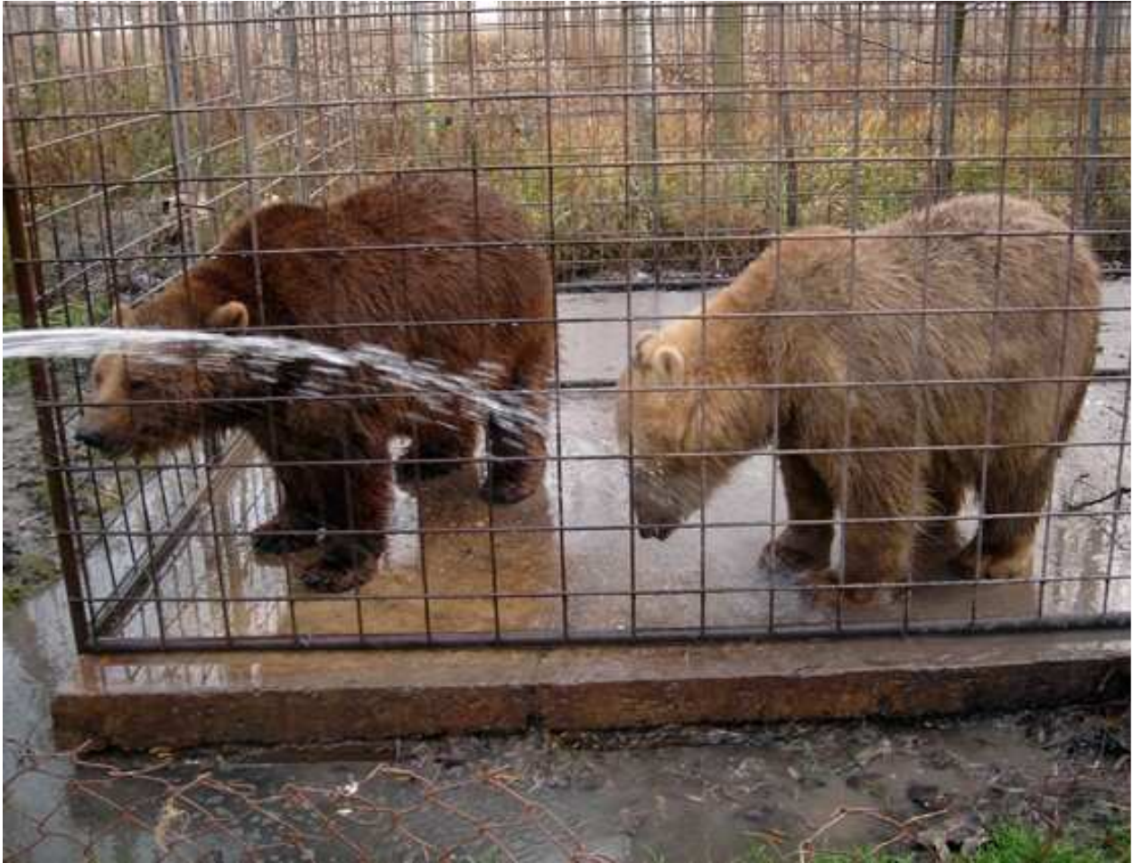
Jasna i Balu u njihovom starom kavezu.

S obzirom na to da ni našem udruženju ne cvetaju ruže, morali smo da se damo u potragu za sponzorima.