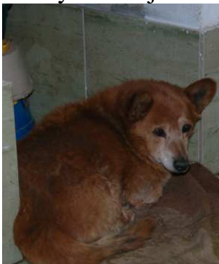
...i u prihvatilištu.

Kao nekada u Zrenjaninu idemo da hranimo pse svakodnevno i tako vršimo moralni pritisak. Pokušavamo da se brinemo i smestimo pse i da ostanemo u dobrom kontaktu sa opštinom. Planiran je sličan, ali značajno manji prostor nego u Zrenjaninu. Nadamo se da još ove godine dobijemo neopodne dozvole za novo prihvatilište. Velika prepreka ipak još uvek postoji: Mi, to znači naše Društvo za zaštitu životinja, nemamo dovoljno novca da bi počeli ovaj novi projekat. Ja opštini u Bečeju nisam ništa o tome rekla, jer ni u kom slučaju ne želim time da ugrozim napredak projekta.