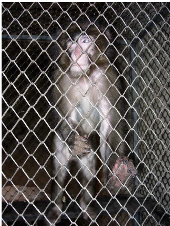
Usamljeni slepi majmun iz Ade.

preduzmemo građevinske promene u korist životinja bez saglasnosti gradske uprave. Od prošlog decembra, naime, čekamo na to.