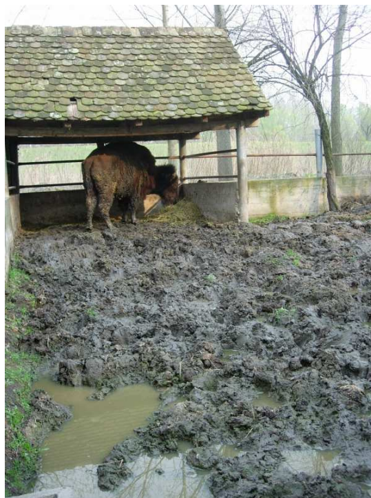
Životni prostor bizona je velika bara.

Iako sam čvrsto odlučila da u naše prihvatilište u Đurđevu više ne uzimam velike životinje iz razloga prostora i novca, ponovo su se pojavila dva hitna slučaja, koje nisam mogla da odbijem.