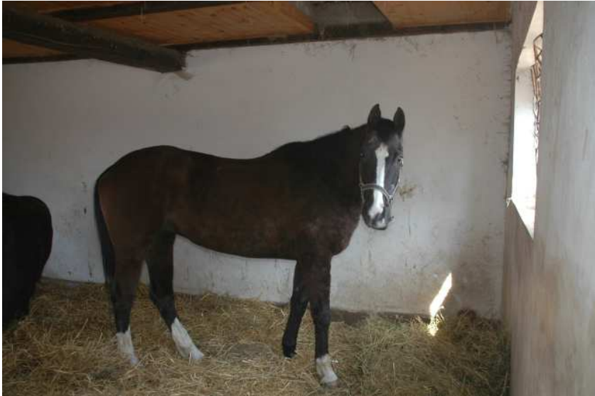
Nimfa kod nas

Okolo pasa uvek ima najviše posla. To je stalno dolaženje i odlaženje. Skoro svakodnevno se nove životinje predaju, često u jednom stanju.