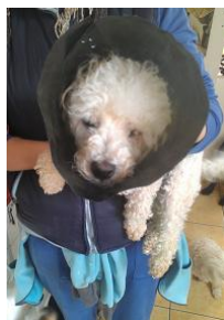
Selbstgemachte Body's anstatt der unangenehmen Halskragen