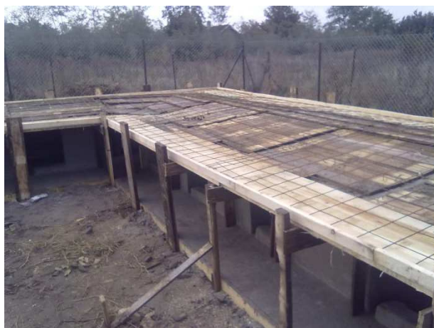
Slike gradnje kućica za pse u azilu u Subotici.

Za kraj želim Vama, dragi prijatelji životinja, da prenesem malu božićnu priču: