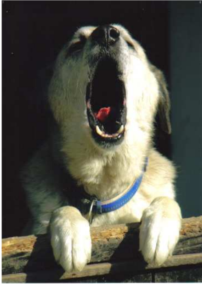
Daram (levo): „Šef grupe,, mladi (desno) Tibi liže kantu sa hranom!“