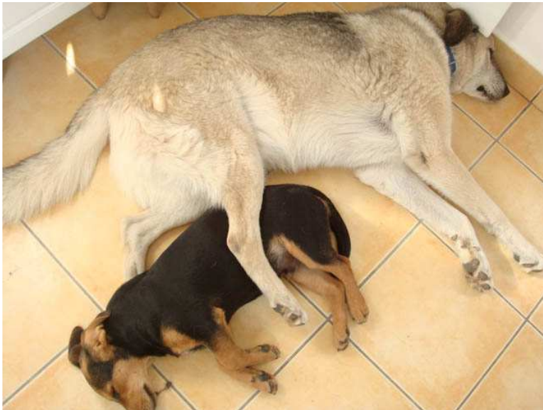
Daram i Lenka:

Iako ne možemo da spasimo sve životinje, MNOGE prežive zahvaljujući našoj pomoći.