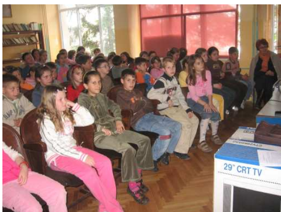
Nastava zaštite životinja u Beškoj.

Ipak nismo se dali tako lako pobediti. Odmah smo potražili pogodan prostor izvan škole i našli smo ga preko puta škole. Predavanja o zaštiti životinja se nastavljaju u Beškoj na radost i oduševljene dece .